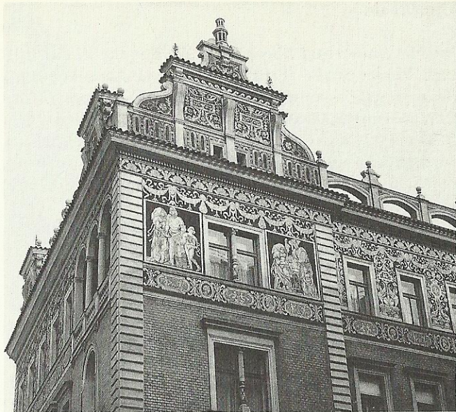
Max Brod's Wohnung in der Schallengasse