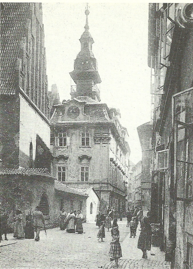
Das Jüdische Rathaus, links die Altneusynagoge, 1905